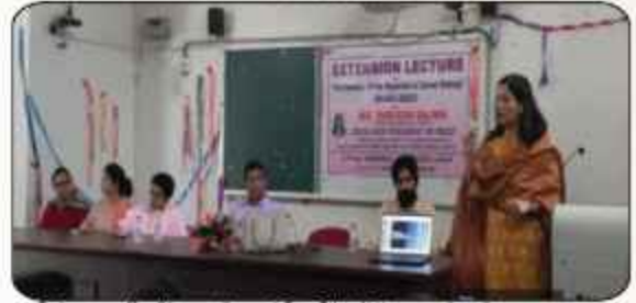
ਕੋਰੀਅਰ ਕਾਊਂਸਲਿੰਗ ਅਤੇ ਗਾਈਡੈਂਸ ਸੈੱਲ ਵੱਲੋਂ ਕਰਵਾਏ ਗਏ "Extension Lecture" ਦੌਰਾਨ ਸ਼੍ਰੀਮਤੀ ਤਰਵੀਨ ਬਾਜਵਾ (Renowned Motivational Spcacr) ਆਪਣੇ ਵਿਚਾਰ ਸਾਂਝੇ ਕਰਦੇ ਹੋਏ