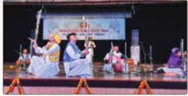
ਗੁਰੂ ਨਾਨਕ ਦੇਵ ਯੂਨੀਵਰਸਿਟੀ ਵੱਲੋਂ ਕਰਵਾਏ ਗਏ ਚੋਨਲ ਯੁਵਕ ਮੇਲੇ ਵਿੱਚ Folk Orchestra ਵਿੱਚ ਪਹਿਲਾ ਸਥਾਨ ਹਾਸਲ ਕਰਨ ਵਾਲੀ ਕਾਲਜ ਟੀਮ