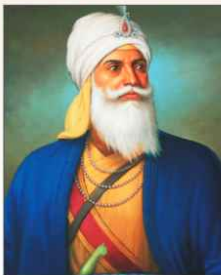
ਨਵਾਬ ਜੱਸਾ ਸਿੰਘ ਆਹਲੂਵਾਲੀਆ