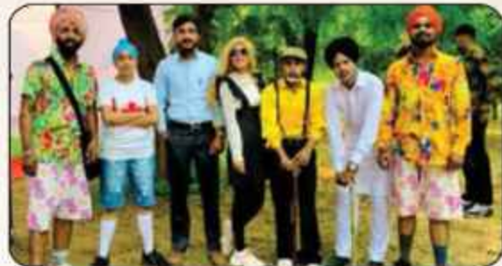
ਗੁਰੂ ਨਾਨਕ ਦੇਵ ਯੂਨੀਵਰਸਿਟੀ ਫੈਲੋ ਕਰਵਾਏ ਗਏ ਜ਼ੋਨਲ ਯੁਵਕ ਮੇਲੇ ਵਿੱਚ ਸਕਿੰਟ ਵਿੱਚ ਦੂਜਾ ਸਥਾਨ ਹਾਸਲ ਕਰਨ ਵਾਲੇ ਕਾਲਜ ਵਿਦਿਆਰਥੀ