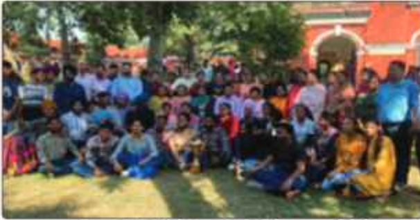
ਗੁਰੂ ਨਾਨਕ ਦੇਵ ਯੂਨੀਵਰਸਿਟੀ ਵੱਲੋਂ ਕਰਵਾਏ ਗਏ ਚੋਨਲ ਯੁਵਕ ਮੇਲੇ ਵਿੱਚ ਦੂਜਾ ਸਥਾਨ ਹਾਸਲ ਕਰਨ ਉਪਰੰਤ ਜੇਤੂ ਟਰਾਫੀ ਨਾਲ ਕਾਲਜ ਪ੍ਰਿੰਸੀਪਲ, ਸਟਾਫ ਮੈਂਬਰ ਅਤੇ ਵਿਦਿਆਰਥੀ