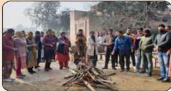
ਕਾਲਜ ਵਿੱਚ ਲੋਹੜੀ ਦਾ ਰਿਚਿਹਾਰ ਮਨਾਉਂਦੇ ਹੋਏ ਕਾਲਜ ਪ੍ਰਿੰਸੀਪਲ ਅਤੇ ਸਟਾਫ ਮੈਂਬਰ