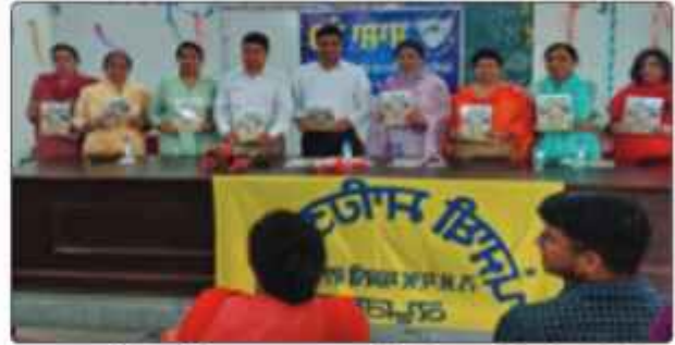
ਕਾਲਜ ਦੇ ਪੰਜਾਬੀ ਵਿਭਾਗ ਦੁਆਰਾ ਫੁਪਵਾਏ ਗਏ ਸਲਾਨਾ ਮੈਗਜ਼ੀਨ 'ਆਰੇਭ' 2022-23 ਨੂੰ ਲੋਕ ਅਰਪਿਤ ਕਰਦੇ ਹੋਏ ਕਾਲਜ ਪ੍ਰਿੰਸੀਪਲ ਅਤੇ ਸਟਾਫ ਮੈਂਬਰਜ਼