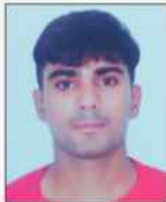
ਗੌਰਵ, ਥੀ.ਏ. ਭਾਗ ਤੀਜਾ ਤਾਇਕਵਾਡੋ (ਤੀਜਾ ਸਥਾਨ) ਅਤੇ ਰੋਲ ਆਫ ਆਨਰ