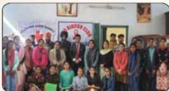
ਕਾਲਜ ਦੇ ਬਾਟਨੀ ਵਿਭਾਗ ਅਤੇ ਰੋਡ ਰੀਸਨ ਕਲੱਬ ਦੁਆਰਾ 'World Heart Day' ਦੇ ਮੌਕੇ ਕਾਲਜ ਪ੍ਰਿੰਸੀਪਲ, ਸਾਇੰਸ ਵਿਭਾਗ ਦੇ ਪ੍ਰੋਫੈਸਰ ਸਾਹਿਬਾਨ ਅਤੇ ਵਿਦਿਆਰਥੀ ਨਾਲ